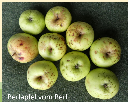
Berlapfel vom Berl

Geschichte: Die Reiser wurden in Grub bei Uffing von einem alten Baum entnommen. Beim „Berl“ in Ohlstadt gibt es heute einen ca. 30 Jahre alten Boskoopbaum, auf dem ein Ast vom „Berlapfel“ veredelt wurde, der sich genetisch wesentlich von dem älteren Baum aus Grub bei Uffing unterscheidet.